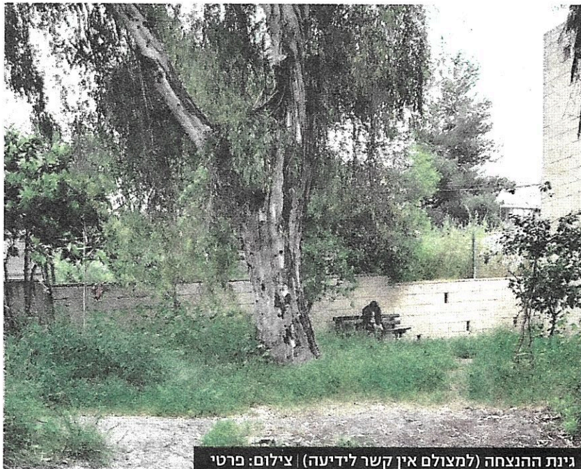
גינת הנצחה (למצולם אין קשר לידיעה)