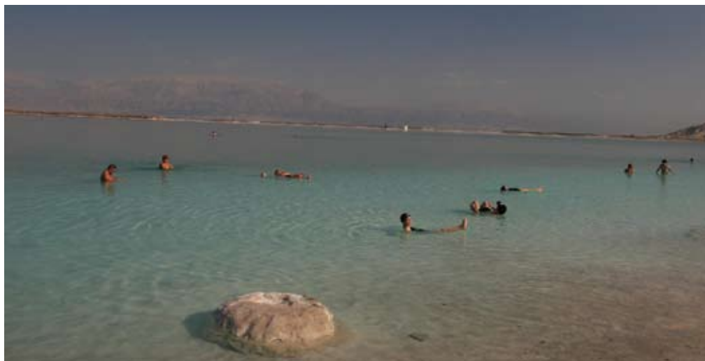
Das Tote Meer mit seinem hohen Salzgehalt - das abwechslungsreiche Israel hat den Jolies imponiert

Durch die jüdische Religion gibt es keine Einschränkungen bei der Behandlung. „Der Standard dort ist mit unserem Niveau vergleichbar, bei der Prophylaxe eher sogar höher“, sagt Jolie. Besonders die Prophylaxeschulungen für die Kinder hätten einen hohen Stellenwert. Amalgam